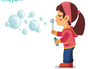
Respiración de burbujas Inhala lentamente por la nariz. Aguanta por 2. Sopla por 6.

Recuerda que tu valor no se basa en tus calificaciones, cómo te va en un examen o qué tan bien te desempeñas en otras áreas de tu vida. ¡Eres maravilloso(a), valioso(a) y importante simplemente porque eres TÚ!